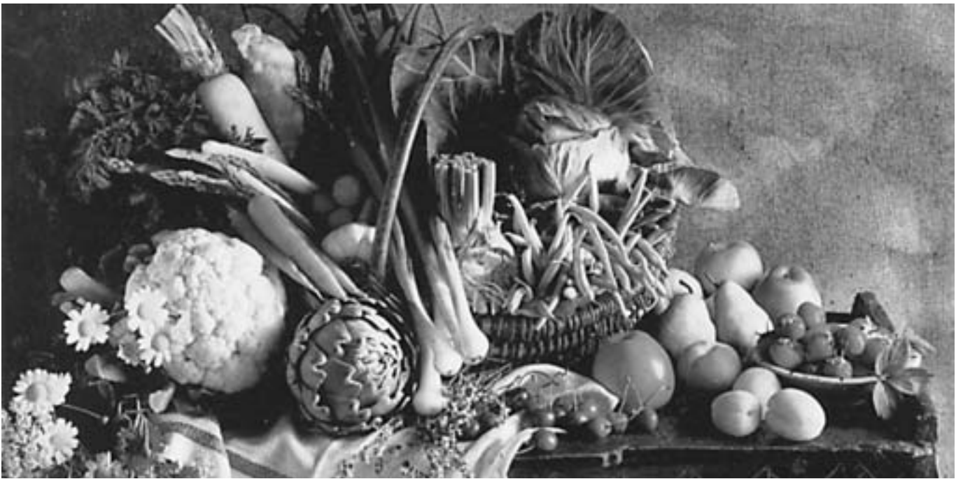
Saisonale, frische und natürliche Produkte aus der Region – Genuss und Gesundbrunnen.