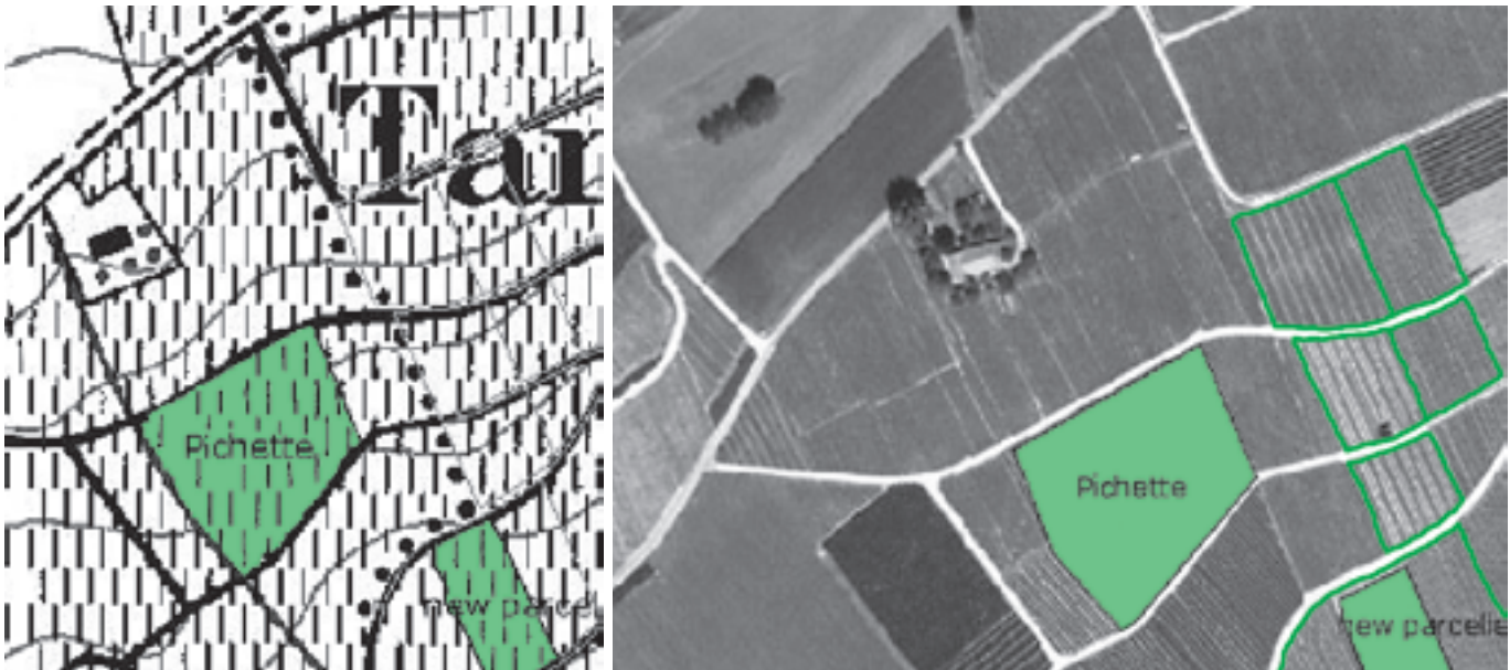
Die Grafik rechts zeigt einen Landwirtschaftsbetrieb mit den einzelnen Parzellen. Die Grafik links zeigt eine einzelne Parzelle, wie sie über das Internet im Programm Réseau Interaktiv en Viticulture (RIV) dargestellt ist. Das RIV wird von den Weinbauern auch als Parzellenverwaltungs-Instrument eingesetzt. Mehr Infos: siehe Box auf Seite 4.