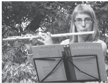
Schon seit der Kanti: Freude am Querflötenspiel

DV. Die diesjährige Delegiertenversammlung der AGRIDEA findet am 29. 9. 2011 in Châteauneuf-Sion VS statt.