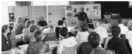
Präsentation des Projekts

Führt man in einer Weinregion einen Kurs durch, darf auch eine Degustation nicht fehlen. Die wohlschmeckenden Weine aus der Region regten viele Kurs-