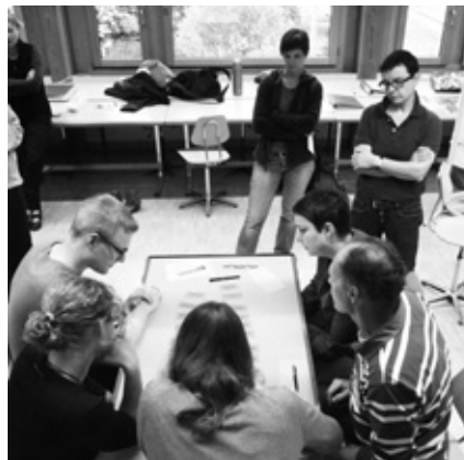
Situationen im AGRIDEA-Kurs

punkt und ist für alle offensichtlich. Darunter – unter der Oberfläche – laufen die zwischen den Menschen bestehenden Gefühle ab: Sympathie, Antipathie, Neid, Wohlwollen, Konkurrenz, Zustimmung, Anziehung, Ablehnung, Nähe, Distanz (vgl. Eisbergmodell, siehe Grafik unten). Selten werden die Inhalte dieser Ebene in Gruppen direkt thematisiert. Häufig entwickeln Gruppen, deren Mitglieder sich gut miteinander verstehen, ihr Thema mit Leichtigkeit und bringen es voran. Harzt es aber zwischen den Menschen, leidet zuerst die Sachebene. Ideen werden nicht aufgenommen, Vorschläge nicht unterstützt. Nichts und niemand kommt zum Blühen. In diesem Moment ist es ratsam, die Störungen auf der Beziehungsebene anzugehen oder eben der Gruppendynamik Beachtung zu schenken.