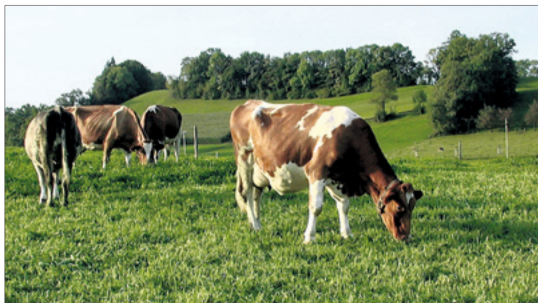
Wer sich überlegt, die Milchproduktion aufzustocken, sollte auch Alternativen dazu in die Entscheidungsfindung miteinbeziehen.