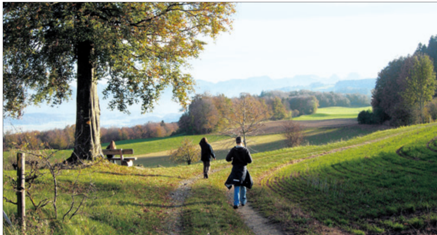
Momente des Glücks und der Entspannung, soziale Kontakte, zur freien Verfügung stehende Zeit: Diese und viele andere Faktoren bestimmen die individuelle Lebensqualität.

Das kann nicht einfach von anderen übernommen werden: So ist es für die einen elementar