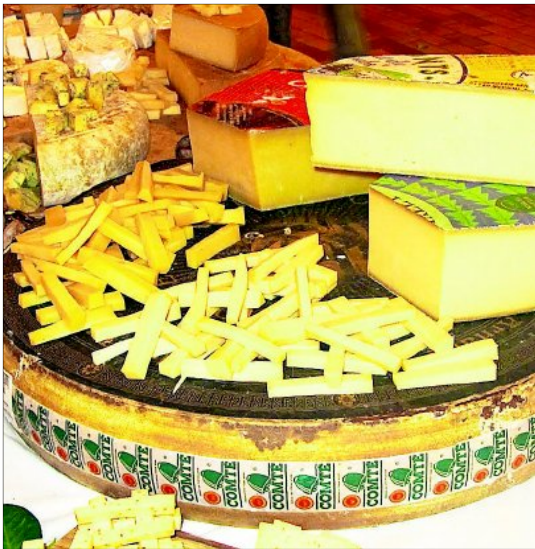
Der Comté war der erste Käse in Frankreich, der 1958 per Dekret die begehrte Auszeichnung «Appellation d'Origine Contrôlée AOC» erhalten hat.

Der Comté war der erste Käse in Frankreich, der 1958 per Dekret die begehrte Auszeichnung «Appellation d'Origine Contrô-