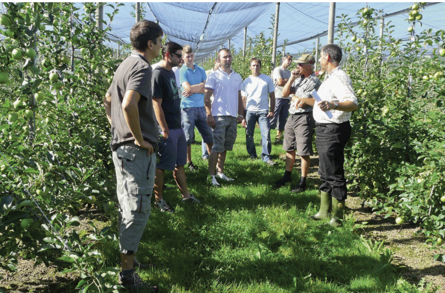
Besichtigung einer Apfelanlage in Süddeutschland.

Auskünfte: Esther Bravin, E-Mail: esther.bravin@acw.admin.ch, Tel. + 41 44 783 62 44