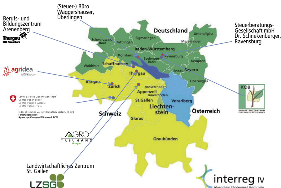
Abb. 1 | Projektgebiet und Projektpartner.

In diesem Bericht wird auf Teilprojekt 3 «Beratung und Schulung» eingegangen. ➤