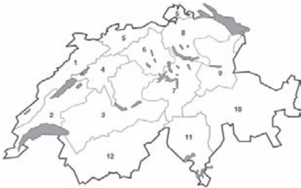
Abb. 1 | Einteilung der Schweiz in 12 Dürrfutter-Erfassungsregionen.